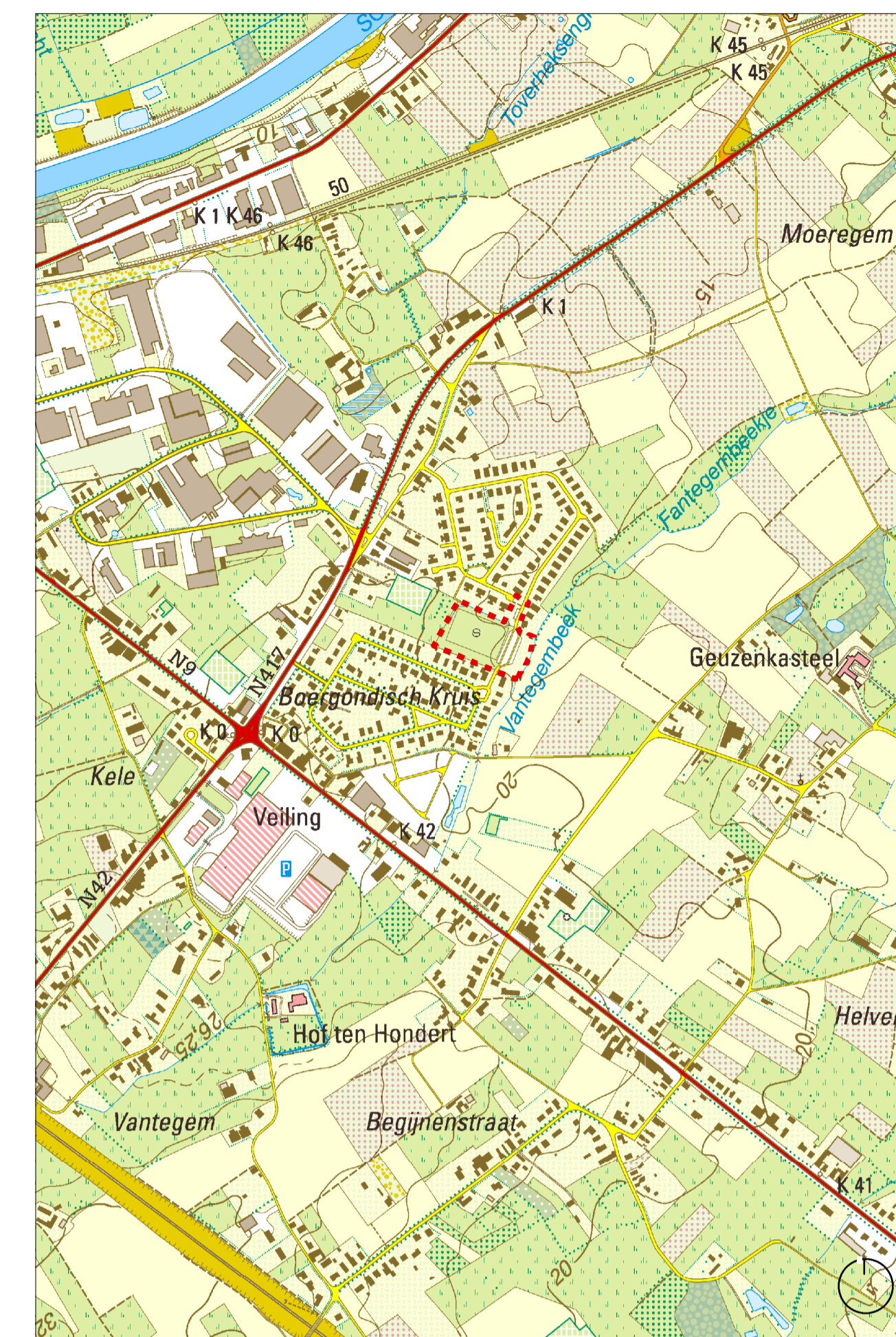
dit plan werd gemaakt op basis van de topografische kaart in kleur, aangevuld met gegevens van eigen terreinbezoek

PROVINCIE Oost-Vlaanderen GEMEENTE Weteren RUP BLAUWE PAAL GRAFISCH PLAN OPDRACHTGEVER GEMEENTE WETTEREN vertegenwoordigd door Els Van Gysegem Rode Heuvel 1 9230 Weteren ONTWERPER OMGEVING cvba www.omgeving.be Uitbreidingstraat 390 2800 Antwerpen-Berchem tel +32 3 448 22 72 fax +32 3 440 13 93 Paul Vuillaume ruimtelijk planner Anne Declerck ruimtelijk planner