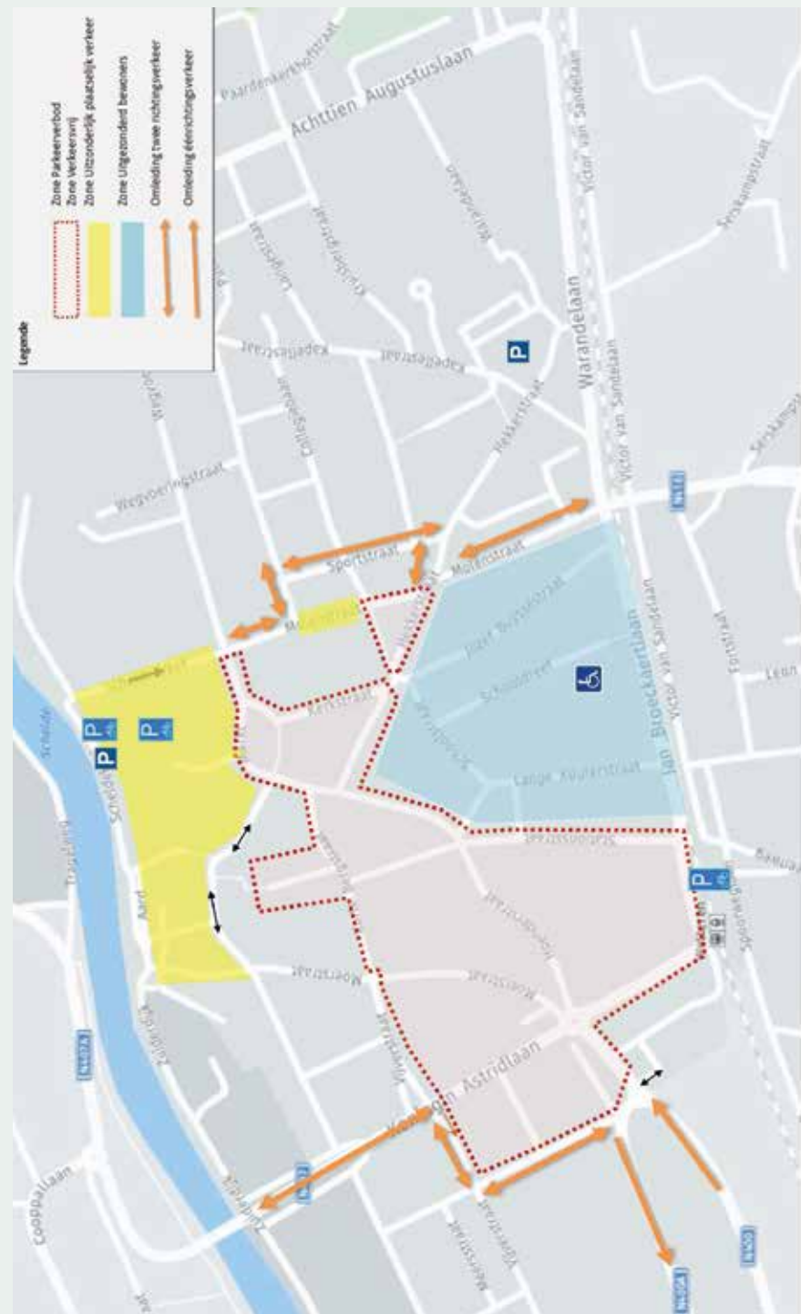
dinsdag 3 september jaarmarkt en kermis